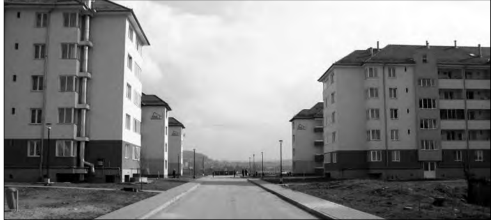
Peste 30 de familii tinere așteaptă, cu bagajele la ușă, mutarea în casă nouă pe strada Predeal

În altă ordine de idei, 6 familii de tineri care aveau cereri depuse pentru repartizarea unei locuințe ANL au primit săptămâna aceasta o veste bună din partea comisiei care se ocupă de stabilirea listei de priorități. Pentru că mai mulți chiriași din blocurile ANL de pe strada Sinaia fie au plecat din oraș, fie au renunțat la apartamente sau garsoniere, 6 dintre persoanele aflate pe lista de așteptare au primit cheile apartamentelor. Locuințele