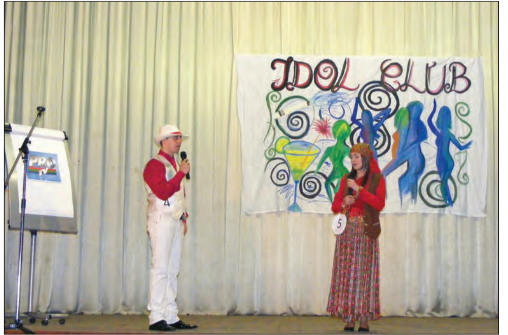
Pe scena Sălii Traube vor urca cei mai frumoși și talentați liceeni mediașeni

Ca și anul trecut, „Balul Liceelor” are și un caracter caritabil, fondurile încasate urmând să fie donate elevilor mediașeni care provin din familii defavorizate sau elevilor care au rezultate bune la învățătură și o situație materială precară.