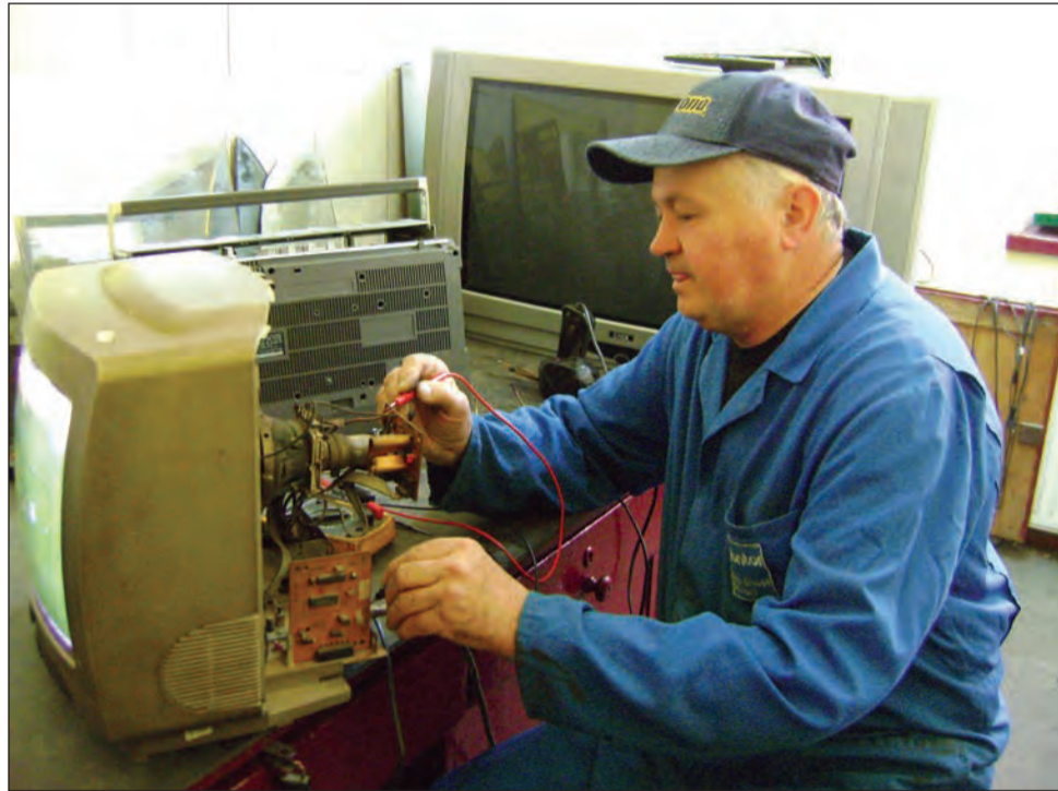
Calmi, cu zâmbetul pe buze, gata să repare orice defect, meseriașii au reapărut în viața noastră

După o relativă perioadă de bunăstare cu lanțuri de magazine, în care medieșenii au profitat din plin de super-oferte de televizoare, clienții de la atelier s-au rărit. A venit însă criza, banii au fost tot mai puțin, iar din magazine medieșenii au ajuns la atelierul de reparații. "Se simte clar o creștere la numărul de reparații, cred că acum sunt undeva la 100 pe lună, poate chiar mai multe. Poate că și omul se gândește mai mult înainte de a cumpăra sau de a repara ceva, banii sunt mai puțin acum, se pierd locuri de muncă. Defecțiunile sunt aceleași dintotdeauna, la alimentare, la finali, transformatoare, selectoare, microprocesoare,