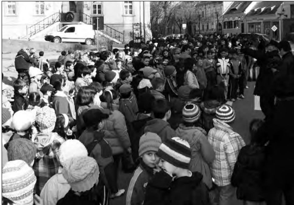
Elevii au părăsit școlile pentru a învăța ce să facă în caz de cutremur

Reprezentatii Inspectoratului pentru Situații de Urgență au constatat că atât cadrele didactice cât și elevii au început să învețe ceea ce au de făcut în cazul unei situații de urgență. „Aspectul pozitiv al acestui exercițiu a fost comportamentul elevilor și al cadrelor didactice. În ceea ce privește sistemul de alarmare al municipiului Mediaș, cu sprijinul edililor șefi, ne vom gândi la o reparaționare a mijloacelor de înștiințare – alarmare cu precădere pe institu-