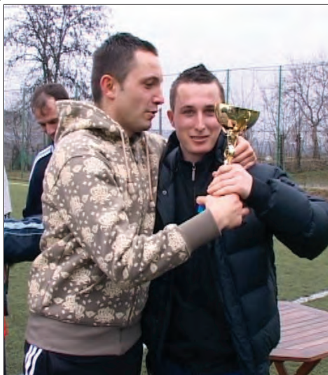
Primul trofeu al competiției a revenit echipei Armax Gaz

Competiția de minifotbal organizată sâmbăta și duminica trecută a fost prima dintr-o serie pe care societatea Armax Gaz intenționează să le organizeze. Practic, se dorește ca aceasta să devină o tradiție, iar de la o ediție la alta, numărul echipelor participante și a jucătorilor înscriși să crească. „Vrem ca această competiție, Cupa Armax Gaz, să devină o tradiție. Această cupă va fi susținută în continuare