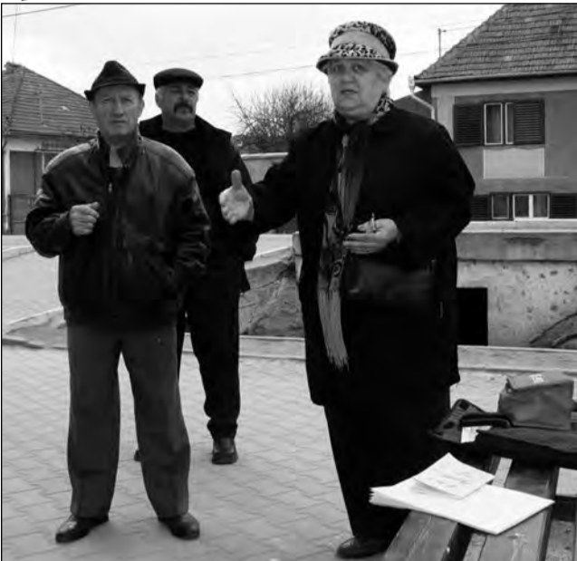
Câteva zeci de păgubiți FNI din Mediaș și Seica Mare au din nou speranțe că-și pot recupera banii

CNVM, autoritatea de supraveghere a pieței de capital, trebuie să achite despăgubiri de peste 50 de milioane de euro la nivel național.