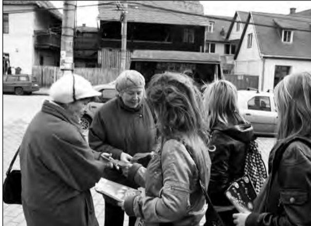
Elevii au încercat să sensibilizeze populația cu privire la problema apei prin intermediul pliantelor

Ziua Mondială a Apei a fost marcată și de Administrația Bazinală Mureș în colaborare cu Liceul Automecanica. Sub genericul „Mediaș-Orașul apei curate”, cele două instituții au desfășurat o acțiune informativă în zona centrală a orașului. „Am venit împreună cu elevii pentru că ne-am propus să tragem un semnal de alarmă despre ceea ce întâmplă la nivel mondial cu problema apei. Am împărțit pliante informa-