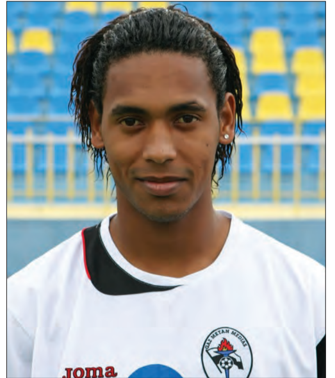
Brazilianul a deschis scorul printr-o reușită de excepție